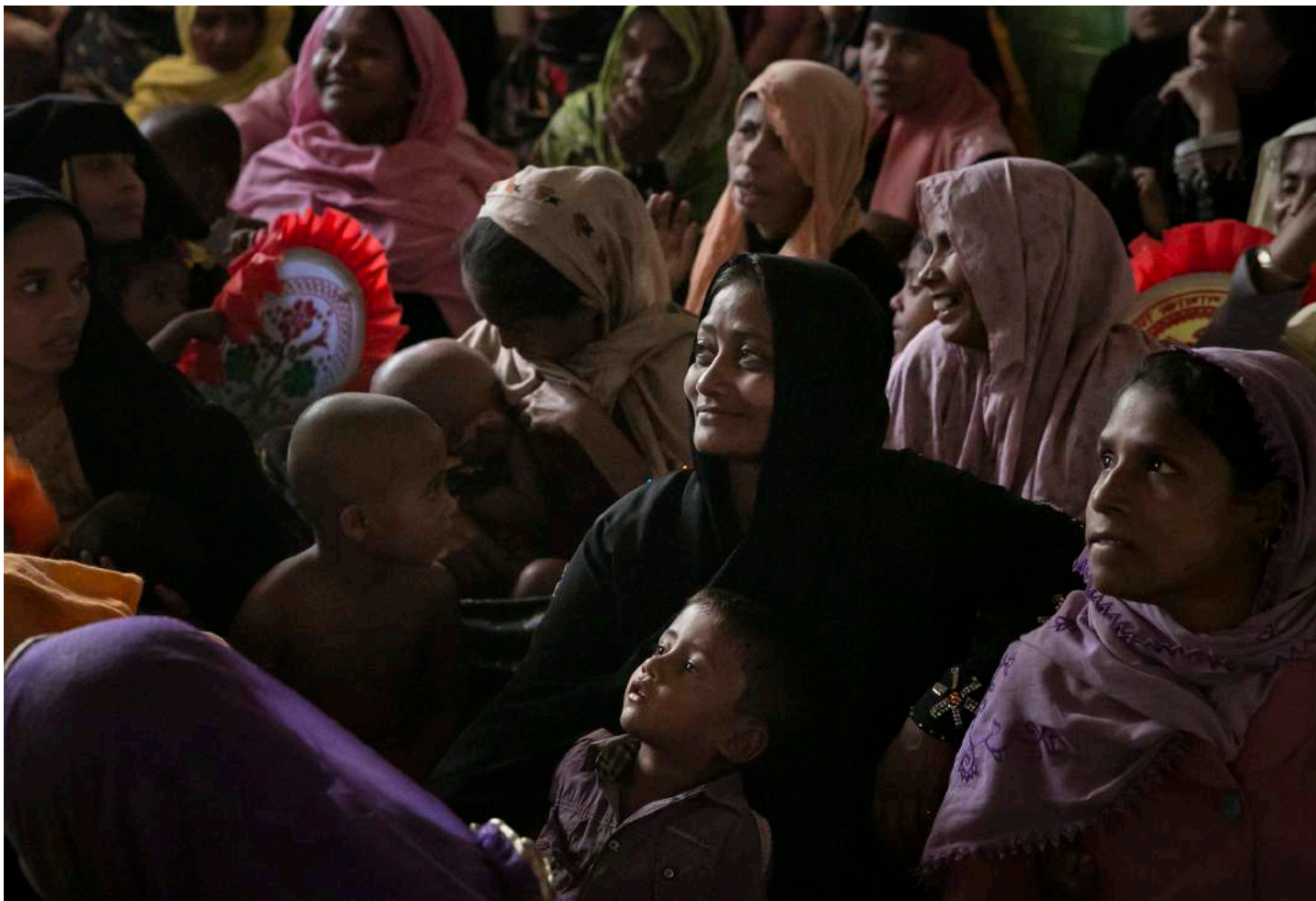
Kutupalong camp, March 8, 2018

Este conjunto de herramientas para identificar la persecución de género se elaboró en colaboración con la Clínica de Derechos Humanos y Justicia de Género (HRGJ, por sus siglas en inglés) de la Facultad de Derecho de City University of New York (CUNY) y MADRE, en colaboración con ONU Mujeres. La Agencia Sueca de Desarrollo Internacional (SIDA, por sus siglas en inglés), Global Affairs Canadá y el Ministerio de Relaciones Exteriores de los Países Bajos proporcionaron un generoso apoyo financiero a través de una asociación con el Programa de las Naciones Unidas para el Desarrollo (PNUD) y su Programa Mundial sobre Estado de Derecho y Seguridad, y Derechos Humanos.